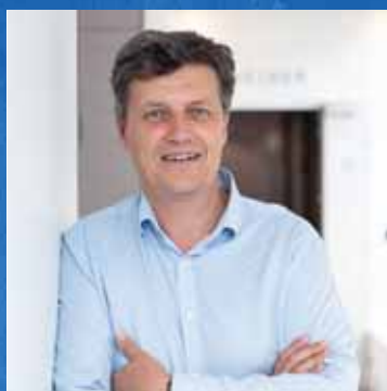
Antoine de Saint-Affrique Directeur Général de Danone

Chez Danone, nous érigeons un ensemble de valeurs et d'attitudes profondément ancrées dans l'identité et l'histoire de notre Entreprise : le double projet et One Planet One Health ne sont pas que de simples mots sur le papier, ils définissent notre comportement et nos agissements.